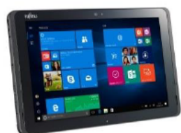
ARROWS Tab Q507/PB

(例) 10.1型ワイド、ビジネスでも安心して使える堅牢防水タブレットARROWS Tab Q507/PBのEX Packセットの場合